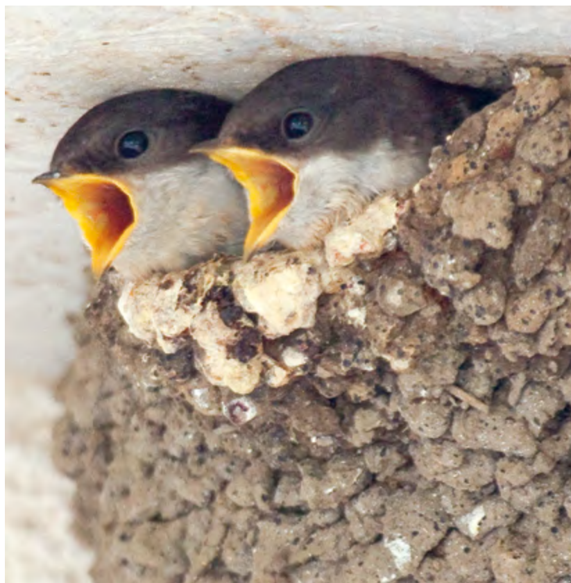
Junge Schwalben warten auf Fütterung. Zu ihrer Hauptnahrung gehören Fliegen, Mücken und Blattläuse. Etwa 500.000 Insekten werden von den Schwalbeneltern für die Aufzucht einer Brut gesammelt und verfüttert. Doch diese werden immer knapper. Laut einer internationalen Studie sind die Vorkommen von Insekten um 80 Prozent geschrumpft!

Zu den 2017 mit einer Schwalbenplakette ausgezeichneten gehören u. a. der Naturschutzstützpunkt Winkelmühle im Presseler Heidewald- und Moorgebiet, der biologisch wirtschaftende Milchschafhof in Leipzig, die Gemeindeverwaltung Großpösna, das Gebäude der Deutschen Bank in Chemnitz, der Mädchenpferdehof in Authausen, Wohnungsgenossenschaften, mehrere Reiterhöfe und natürlich viele Privathäuser.